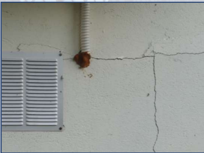
Fissures diagonales ou traversantes