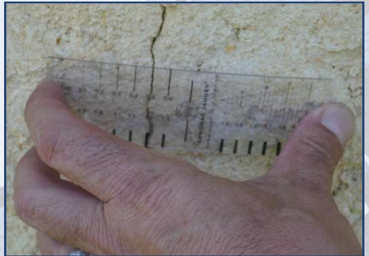
Ouverture progressive en période estivale